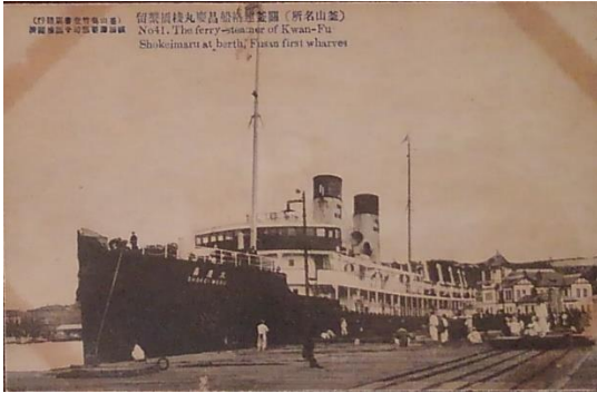
朝鮮 12 「(釜山名所) 関釜連絡船昌慶丸栈橋繫留」。明治 38 年に山陽鉄道傘下の山陽汽船が創業、鉄道の 国有化により鉄道院の経営となった。