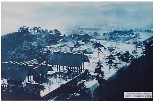
朝鮮 10 「官幣大社朝鮮神宮 (京城)」。大正 14 年創建、祭神は天照大神・明治天皇。