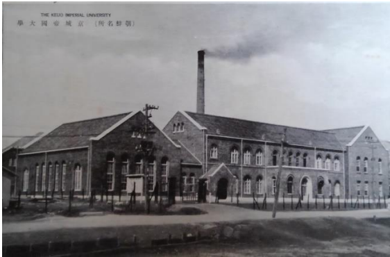
朝鮮 1 「(朝鮮名所) 京城帝國大學」。大正 13（1924）年設立の帝国大学、法文・医学部・理工学部など。

明治 43（1910）の日韓併合条約により併合、同年 9 月に朝鮮総督府が置かれた。前身の韓国統監府初代統監は伊藤博文、総督府の初代総督は寺内正毅であった。