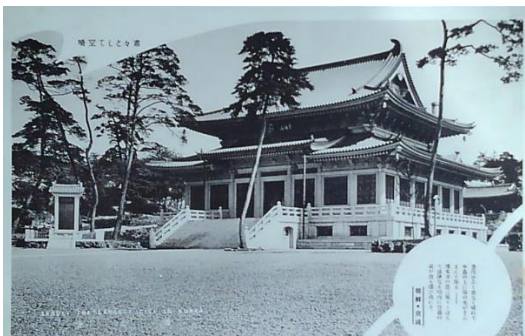
朝鮮 7 「肅々として空青 博文寺 蒼穹ひろく果てなく晴れて半島の上に陽の光がさんさんと降る一博文寺の叢は晃々と冴えて清浄なる境内に崇嚴の気が自ら漂ひ流れる。朝鮮・京城」。伊藤博文追悼のための寺。