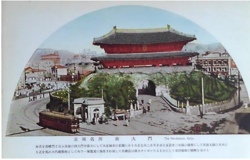
朝鮮 8 「京城名所 南大門 本名を崇禮門と云ふ京城の四大門中最大にして大京城市の玄関にあり大王七年二月今を去る五百廿二年前の建築にして其後文禄の大火にも之を免れ古代建築物として今や一層鄭重に保存され而して其構造は雄大サンゼンたるものにして東洋藝術の精粹を示せり」