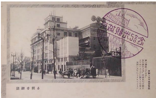
朝鮮 5 殷賑を誇る 京城・三中井百貨店 京城三大デパートメントストアの一として三越・丁子屋と並び称せられ、半島及び大陸方面に発展してゐる。」近江商人中江勝次郎の創業。のち新京にも開店。