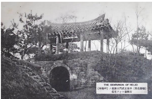
朝鮮 6 「(朝鮮名所) 平壤玄武門日清役ノ古戦場トシテ」有名」