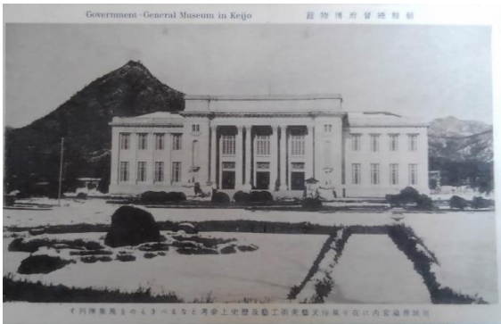
朝鮮 2 「朝鮮総督府博物館 京城景福宮内に在り風俗文芸美術工芸及歴史上参考となるべきものを蒐集陳列す」。大正 14 年 9 月に景福宮え開催された「始政五年記念朝鮮物産共進会」の後に同所に設置された。