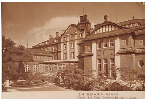
朝鮮 9 「京城 朝鮮ホテル 鉄道局直営」。満洲のヤマトホテルと同じ性格の鉄道ホテル。