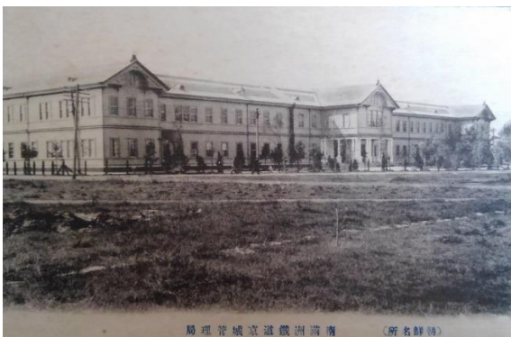
朝鮮 3 「(朝鮮名所) 南滿洲鐵道京城管理局」。大正 6 年 7 月総督府から満鉄に警衛委託された。