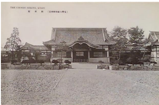
朝鮮 11 「(官幣大社朝鮮神宮) 勅使館」。伊東忠太の設計。ちなみに 7 の博文寺も伊東の設計。