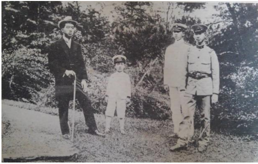
中国ほか 7 「(大人子ども 4人)」、内容不明