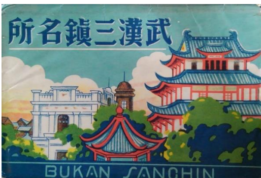
中国ほか6「武漢三鎮名所」（袋のみ）、中身不明