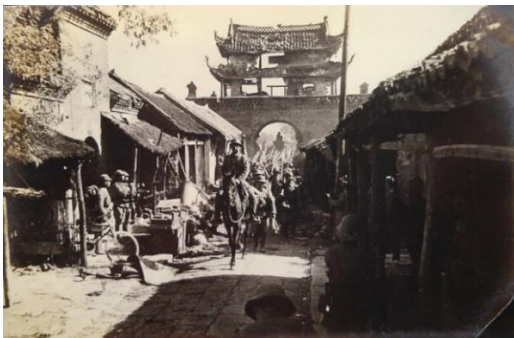
中国ほか4「威風堂々入城する我が精鋭部隊 中支派遣軍報道部写真班撮影」