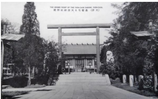
中国ほか5「(天津) 森嚴なる天津神社拜殿」