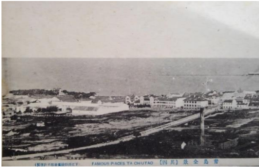
中国ほか3「青島全景（其四）」