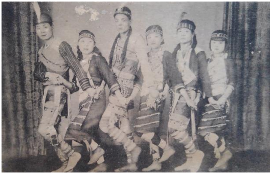
中国ほか 8 「(ダンス、男女 6人)」、内容不明