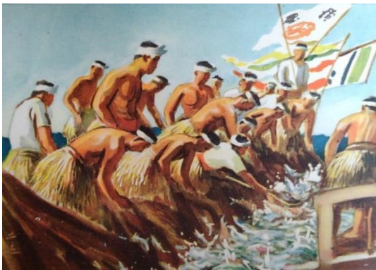
中国ほか 9 「和田三造 郵便貯金七十億圓記念 皇紀二六〇〇年九月」。和田は満洲国建国十周年慶祝献納画「春」を他の洋画家日本画家二十七人とともに描いている。